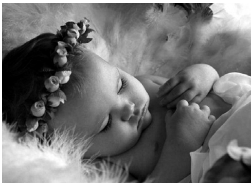
Katram brālītim ir vajadzīga māsiņa.

Šī ir tā dzīvības mācība, kas ir jāmāca jau no bērna kājām! Bet vai var sagaidīt, ka tāda mācība radīsies pati no sevis? Profesionāli urdītāji te nelīdzēs. Līdzēt varētu, ja “Viedā”, “Žulis” un pārējie, līdzīgi domājošie komentētāji, savus uzskatus izkliegtu tautā skaļi un ilgi, ļoti skaļi un ļoti ilgi!