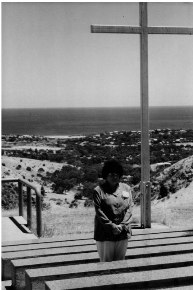
Brīvdabas baznīca "Dzintaros", Normanvillē, Austrālijā. Tālumā St. Vincenta līcis. Līča ziemeļu galā ir Adelaides pilsēta, dienvidu galā Ņenguru sala un Dienvidu okeāns.