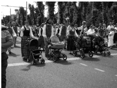
Mēs gribam bērnus! 2008. g. Dziesmu svētku gājiens