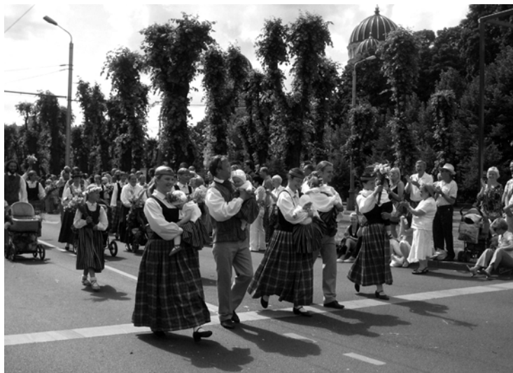
Vēl vienu bērnu Latvijai! 2008. g. Dziesmu svētku gājiens

Problēma 10. Lai paceltu dzimstības līmeni valstī, sabiedrību ir jāinformē par labumu, ko dod bērni. Tādas informēšanas programmas izstrādāšana ir citas studijas tēma. Šeit apmierināsimies ar to, ko saka Jānis Jaunsudabiņš: „Māte uztur dzīvas cilvēku paaudzes atpakaļ līdz Ievai un joprojām līdz pat zemes mūža pēdējai stundai. Māte ir neizsīkstošas mīlestības avots, tāpēc mūžīga kā pati mīla. Māte ir stāvējusi, bērnam piedzimstot, nāves priekšā: mātei nav grūti sava bērna dēļ nomirt kaut kuru brīdi, ja tas būtu vajadzīgs. Māte ir laicības nemirstīgā daļa, cilvēces ciltskoka sakne un reizē zaļa lapa.“