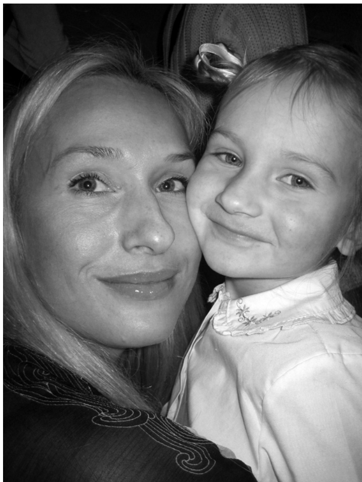
Vēl vienu bērniņu... lūdzu, lūdzu!