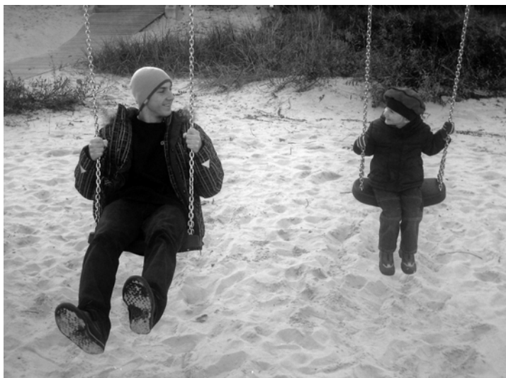
Par bērniem ir jāsāk domāt agrā jaunībā.