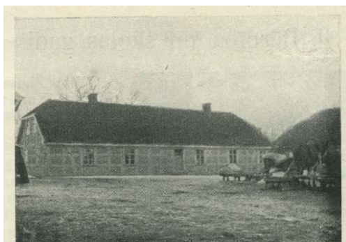
Elzas dzimšanas vieta Kroņabērmuižā. (Toreizējā aptieka.)