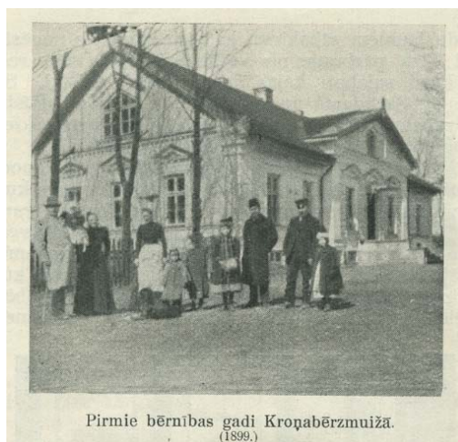
Pirmie bērnības gadi Kroņabērmuižā. (1899.)