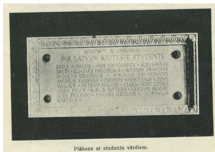
Plāksne ar studentu vārdiem.

Šajā zālē turpmāk vairs ikdienas darbi nenotiks. Tā būs svētnīca, bet šī plāksne altāris, kuŗa svētā liesmā sadegs viss, kas mūsos vēl zems un nekrietns. Te jaunatne smelsies jaunus spēkus un ticību Latvijas brīvībai. Latvija ir skaista zeme un tāpat kā senāk, arī tagad daudzas rokas vienmēr tieksies pēc mūsu skaistās zemes. Tāpēc ir vajadzīgs, lai mēs vienmēr būtu modri un uzticīgi savas zemes sargi. Uz to lai Dievs svētī Latviju!