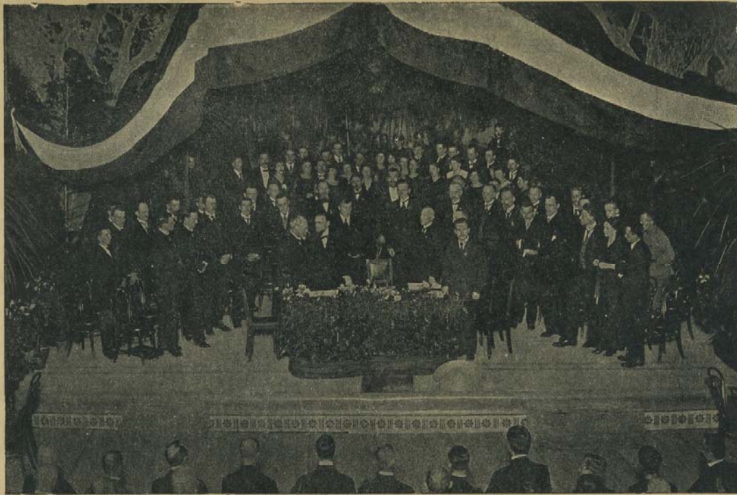
Latvijas brihwvalsts pasludinaschana 18. nowembrī 1918. g. Rīgā.